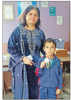
सोनीपत। जियांश के साथ प्राचार्या।