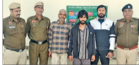
गोहाणा। आरोपितों को गिरफ्तार किए हुए पुलिस।