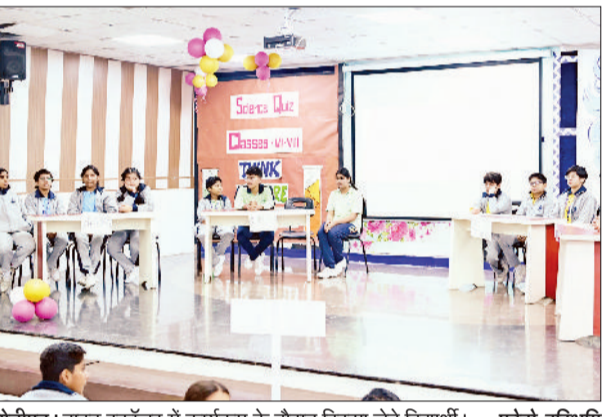
सोनीपत। ब्राइट स्कॉलर में कार्यक्रम के दौरान हिस्सा लेते विद्यार्थी।