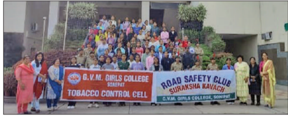
सोनीपत। जीवीएम गर्ल्स कॉलेज में कार्यक्रम के दौरान छात्राएं।