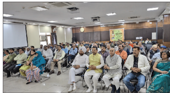
सोनीपत। बैठक के दौरान उपस्थित धार्मिक, सामाजिक संस्थाओं के पदाधिकारी एवं अधिकारियों।