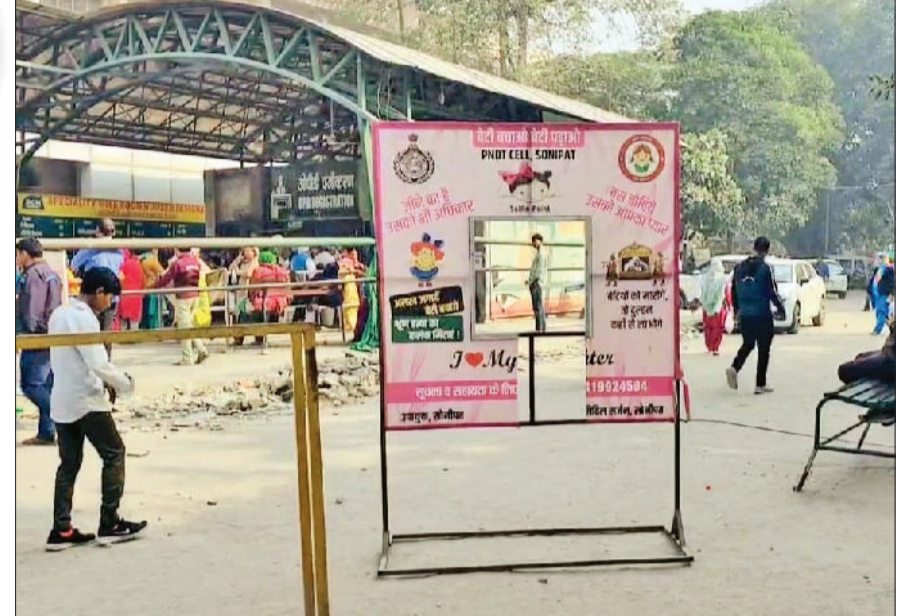
सोनीपत। सेल्फी प्वाइंट जिससे बेरीकेड का काम लिया जा रहा है।

चिंताजनक : कमी सोनीपत का लिंगानुपात सुधार प्रदेश में शीर्ष पर रहता था