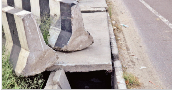
सोनीपत। राई के पास नेशनल हाइवे पर टूटे स्लैब।

करोड़ों की लागत से निर्मित नेशनल हाइवे-44 का कुंडली से पानीपत तक का हिस्सा अब राहगीरों और वाहन चालकों के लिए एक बड़ा खतरा बनता जा रहा है। हाइवे के किनारे सुरक्षा के लिए बनाए गए ड्रेनेज नालों पर लगाए गए स्लैब जगह-जगह टूट चुके हैं या पूरी तरह गायब हैं। यह बदहाल स्थिति देश के सबसे व्यस्त मार्गों में से एक, एनएच-44 की सुरक्षा व्यवस्था पर गंभीर सवाल खड़े करती है, जिसका लोकार्पण 20 जून 2023 को हुआ था और जिसके चौड़ीकरण पर 900 करोड़ रुपए खर्च हुए थे। यह हाइवे दिल्ली सहित हरियाणा, पंजाब, हिमाचल प्रदेश और जम्मू-कश्मीर को जोड़ने वाला एक अत्यंत महत्वपूर्ण मार्ग है। यातायात को सुरक्षित और