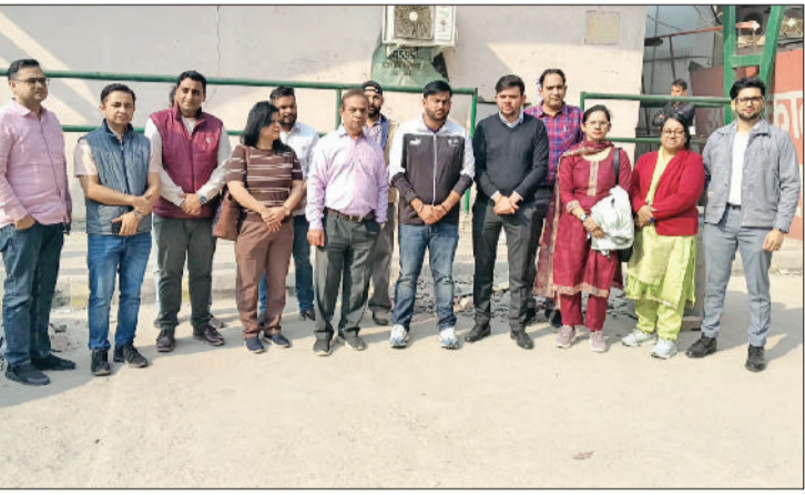
हरिभूमि न्यूज़ ►► सोनीपत

लिंगानुपात कम होने के मामले में वरिष्ठ चिकित्सकों पर संभावित कार्रवाई के विरोध में आज जिले के नागरिक अस्पताल, सामुदायिक स्वास्थ्य केंद्रों (सीएचसी) और प्राथमिक स्वास्थ्य केंद्रों (पीएचसी) में डॉक्टरों ने दो घंटे की पेन डाउन हड़ताल रखी। सुबह 9 बजे से 11 बजे तक चिकित्सकों ने काम बंद रखा, जिसके कारण ओपीडी सेवाएं पूरी तरह टप रहीं और दूर-दराज से इलाज के लिए आए मरीजों को भारी परेशानी का सामना करना पड़ा। डॉक्टरों ने सरकार के खिलाफ रोष जताते हुए