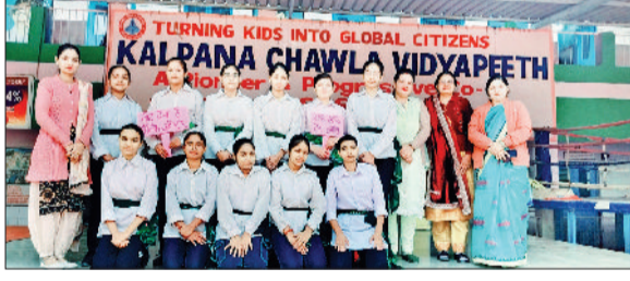
खरखौदा। नुककड़ नाटक के प्रतिभागी कल्पना स्कूल के विद्यार्थी।