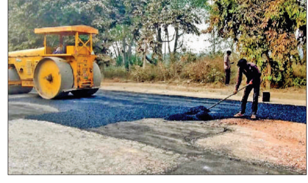
गन्नीर से बड़ी औद्योगिक क्षेत्र सड़क पर डामर की परत डाल कर रिपेयरिंग कर रहे मजदूर।

गन्नीर से बड़ी औद्योगिक क्षेत्र को जोड़ने वाली मुख्य सड़क का रिपेयरिंग का काम एचएसआइआइडीसी ने शुरू कर दिया गया है। जिससे रोजाना इस मार्ग से आने-जाने वाले हजारों कर्मचारी, मजदूर और वाहन चालकों को बड़ी राहत मिलेगी। पिछले दिनों भारी यातायात के कारण सड़क पर गड्ढे हो गए थे। जिस पर विभाग ने कार्रवाई करते हुए सड़क की मरम्मत के लिए 5